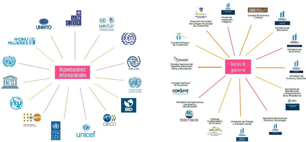
Figura II. Socios SNU y Gobierno de Guatemala

Las agencias líderes de cada prototipo realizarán una presentación de cada proyecto, con enfoque en la justificación, la temporalidad, las acciones y metas, los socios y beneficiarios, así como el presupuesto requerido.