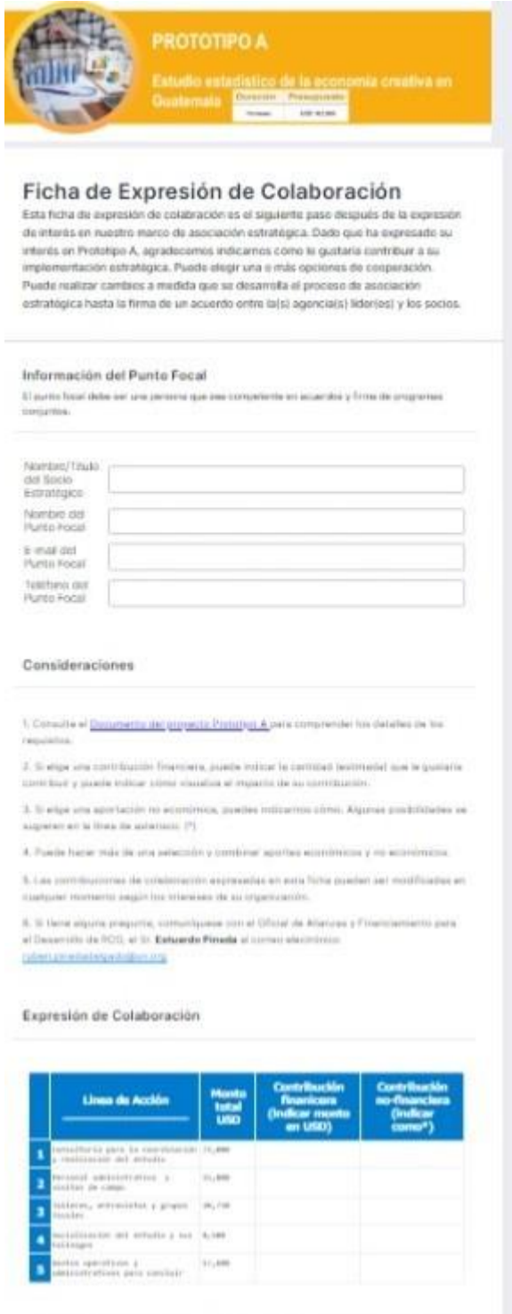
Figura IV. Ficha digital de expresión de colaboración